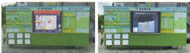
サイネージ写真 (ICT建機画面表示)